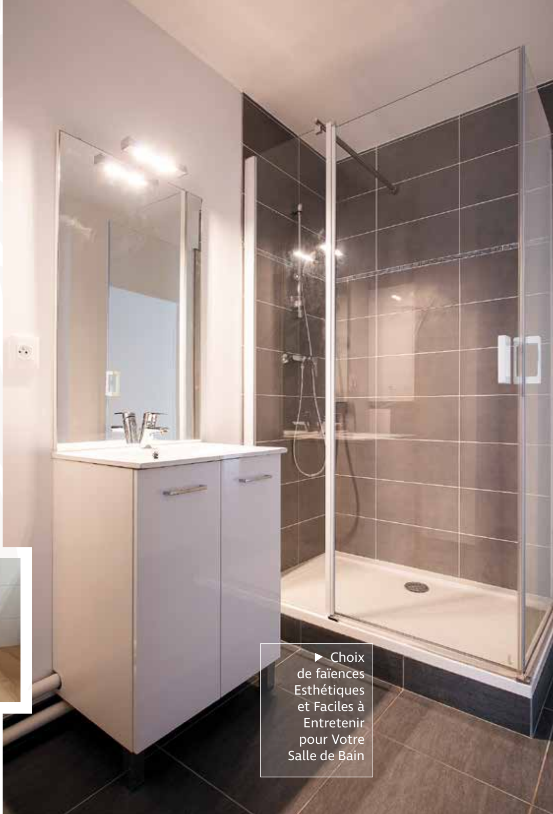
► Choix de faïences Esthétiques et Faciles à Entretenir pour Votre Salle de Bain