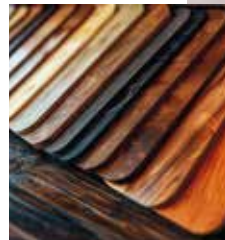
► Choix de coloris